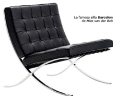
La famosa silla Barcelona de Mies van der Rohe